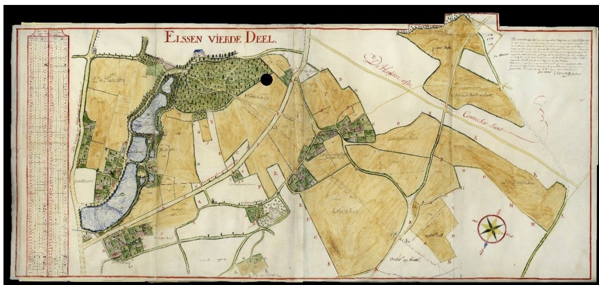
Kaartboek van de abdij Ter Kameren, 1716-172 (ARA, inventaris T 459, nr. 8676/A, scan nr. 28)

Advies, opleiding, overleg, uitwisseling van ervaring, ontmoeting en samenwerking op het vlak van familiekunde en verwante wetenschappen staan daarbij centraal.