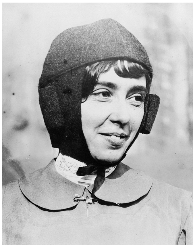
Hélène Dutrieu (1877-1961)

Advies, opleiding, overleg, uitwisseling van ervaring, ontmoeting en samenwerking op het vlak van familiekunde en verwante wetenschappen staan daarbij centraal.