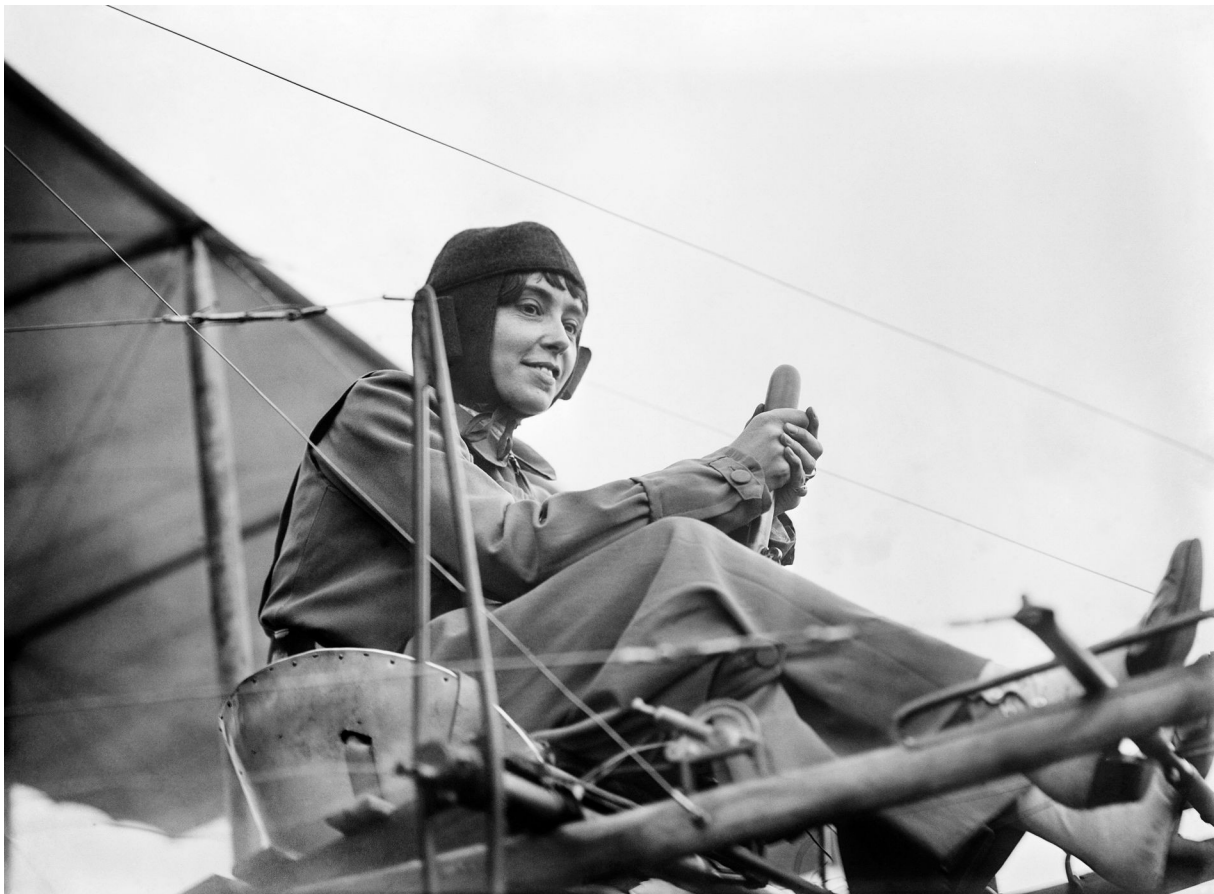
Hélène Dutrieu in haar vliegtuig omstreeks 1911

Op 9 januari 1913 kreeg ze van de Franse regering de onderscheiding Ridder in het Legioen van Eer. In België wordt ze in 1958 door de regering benoemd tot Officier in de Orde van Leopold.