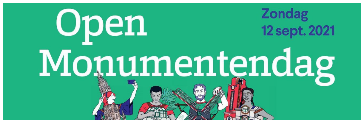
Campagnebeeld Open Monumentendag 2021

Advies, opleiding, overleg, uitwisseling van ervaring, ontmoeting en samenwerking op het vlak van familiekunde en verwante wetenschappen staan daarbij centraal.