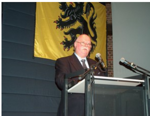
Foto genomen op nationaal congres in Alden Biesen anno 2007.