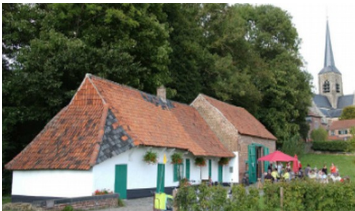
Sint-Martens-Bodegem, Huisje Mostincx

Advies, opleiding, overleg, uitwisseling van ervaring, ontmoeting en samenwerking op het vlak van familiekunde en verwante wetenschappen staan daarbij centraal.