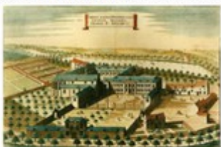
de huidige Parkresidentie Wivina.

Een geschiedenis van de Sint-Wivina-abdij-site van 1794 tot 2016. Over de opheffing van de abdij en de opeenvolgende eigenaars tot