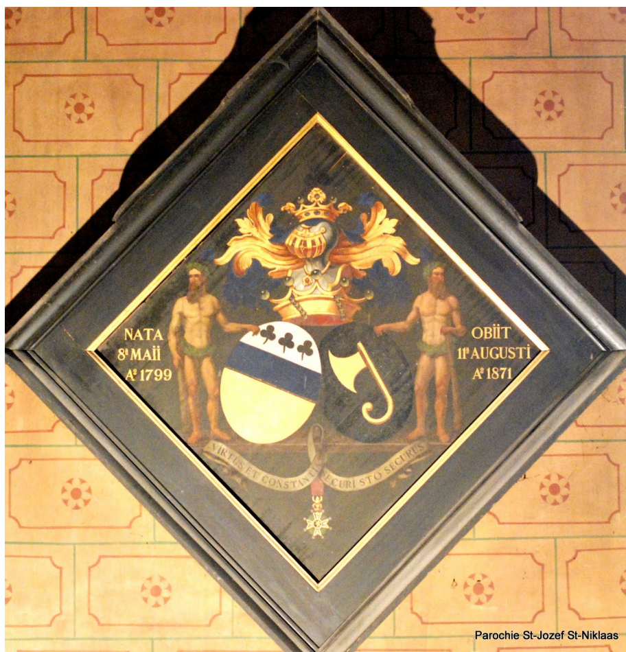
Parochie St-Jozef St-Niklaas

Advies, opleiding, overleg, uitwisseling van ervaring, ontmoeting en samenwerking op het vlak van familiekunde en verwante wetenschappen staan daarbij centraal.