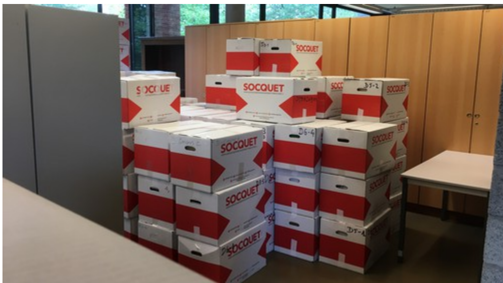
Zicht op de verhuis.

Intussen is de verhuis succesvol gerealiseerd en is onze leeszaal in gereedheid gebracht om onze leden, genealogen en geïnteresseerden terug te ontvangen.